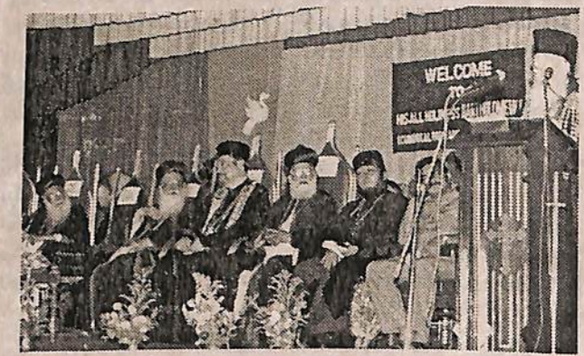
പരുമലയിലെ പൊതുസമ്മേളനം പ. എക്യുമെനിക്കൽ പാത്രിയർക്കീസ് ഉദ്ഘാടനം ചെയ്യുന്നു.

സമർപ്പണ ജീവിതം നയിച്ച സഭാചിന്താക്കന്മാരുടെ ജീവിതവും ദർശനവും സഭയ്ക്കഭിമാനകരമാണെന്ന് സർവ്വശ്രേഷ്ഠ പരിശുദ്ധ എക്യുമെനിക്കൽ പാത്രിയർക്കീസ് ബർത്തലോമിയ ഒന്നാമൻ പ്രസ്താവിച്ചു. പരിശുദ്ധ ബസ്സേലിയോസ് ഔഗേൻ പ്രഥമൻ ബാവായുടെ കൈയായിരുന്നു അദ്ദേഹം. ക്രൈസ്തവ സമൂഹത്തിൽ പരസ്പരം സംസർഗ്ഗമില്ലാത്ത സഭാവിഭാഗങ്ങൾ ഉണ്ട്. ദൈവത്തിൽ വിശ്വസിക്കുന്ന ഏവരും ക്രിസ്തുവിൽ ഒന്നാകുവാൻ നമ്മൾ പ്രാർത്ഥിക്കണമെന്ന് അദ്ദേഹം ആഹ്വാനം ചെയ്തു.